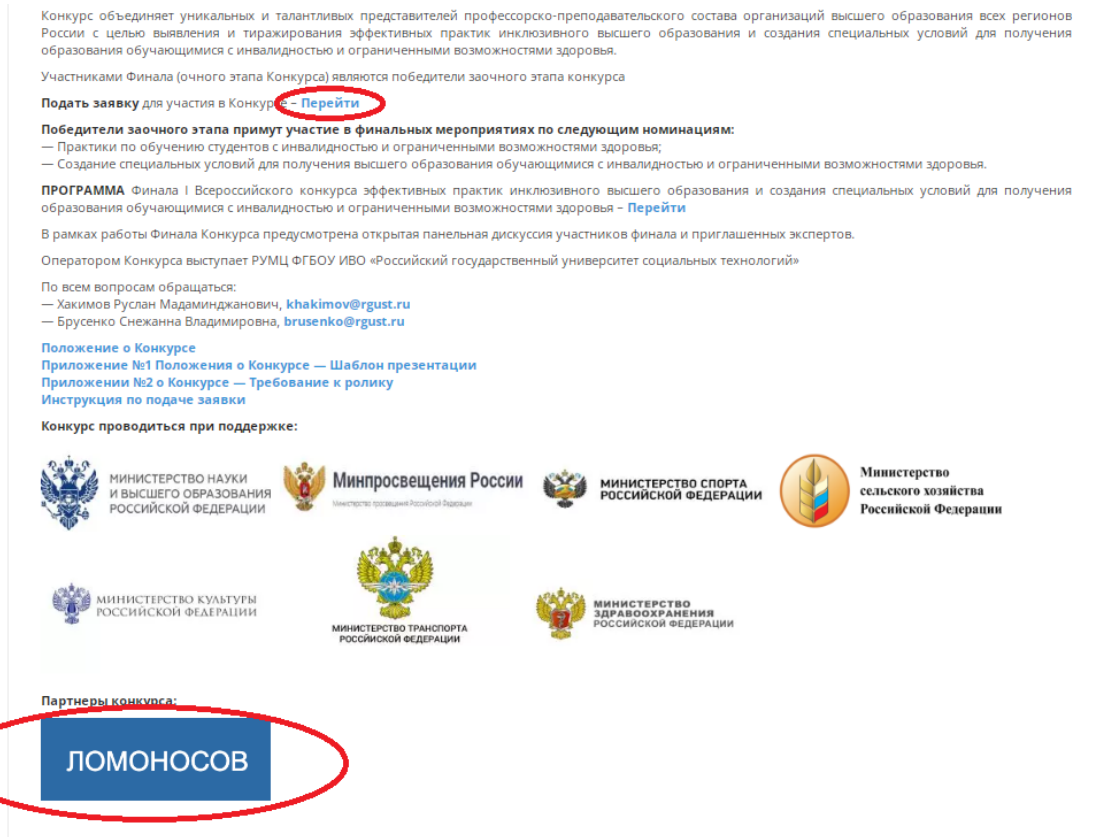
Рисунок 10 – Вид на дополнительную кнопку для подачи заявки для участия в Конкурсе на странице Конкурса

В случае, если у Вас возникли вопросы, пожалуйста, обращайтесь: