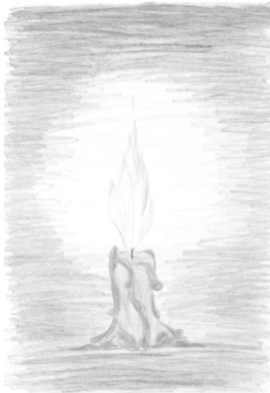
Рис. 1: «Одиночество»