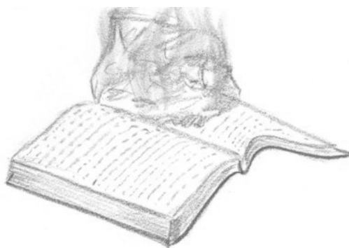
Рис. 3: «Событие, к которому не хотелось бы возвращаться»